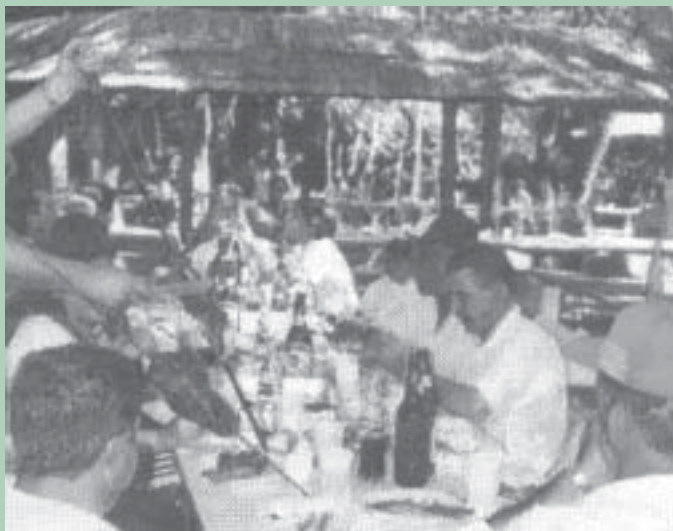
confraternização do Dia do Trabalho reuniu 280 pessoas na AEE/Passo Fundo

O Dia do trabalho foi comemorado no dia 30 de abril, quando a AEE de Passo Fundo, a Embrapa Trigo, o Sinpaf e o Serviço de Negócios Tecnológicos ofereceram um succulento churrasco de integração aos empregados e seus dependentes.