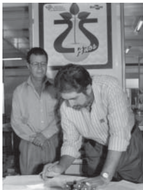
Portugal assina convênio Embrapa-Escola

A partir do aniversário, a Embrapa Soja vai apresentar todos os meses, até abril de 2001, novas tecnologias. A festa comemorativa aos 25 anos da instituição teve início com a posse do Comitê